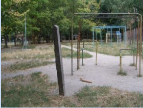
Застаріле обладнання спортивного майданчика