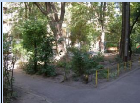
Зелена зона потребує впорядкування