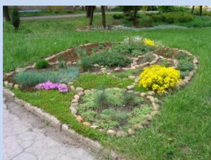
Впорядкування зеленої зони