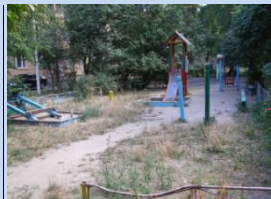
Недостатня кількість елементів дитячого майданчика