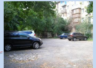
Відсутність зони для паркування