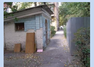
Непривабливий вигляд сміттєзбірника