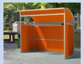
Облаштування контейнерного майданчика на місці старого сміттєзбірника