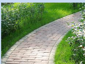
Облаштування та вимощення доріжок