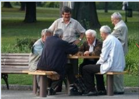
Створення зони для тихого відпочинку