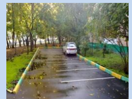
Облаштування зони для паркування автомобілів