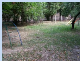
Нераціональне використання прибудинкової території