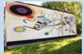
Оформлення фасаду сміттєзбірника