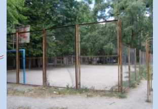
Застаріле обладнання спортивного майданчика