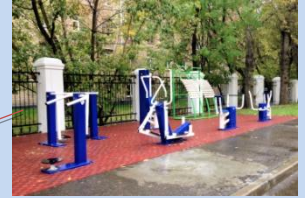
Облаштування зони для спортивного відпочинку