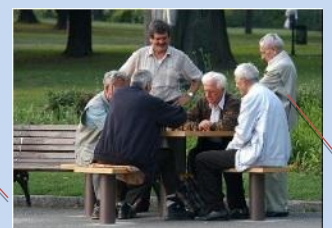
Створення зони для тихого відпочинку