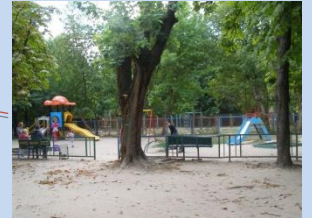
Недостатня кількість елементів дитячого майданчика