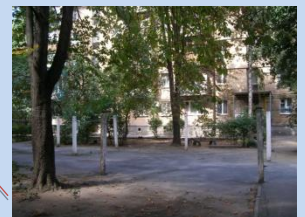
Застаріле обладнання господарського майданчика