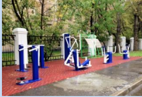
Облаштування зони для спортивного відпочинку