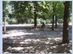
Застарілі конструкції лав для відпочинку