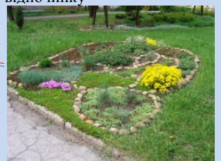
Впорядкування зеленої зони