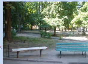
Застарілі конструкції лав для відпочинку, відсутність урн для сміття