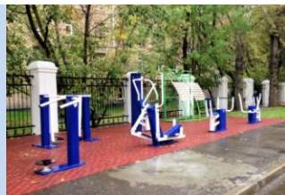
Встановлення спортивних тренажерів на місці старого господарського майданчика