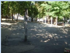
Застарілі конструкції господарського майданчика