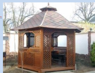
Встановлення альтанки для відпочинку