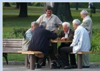
Створення зони для тихого відпочинку на місці господарського майданчика