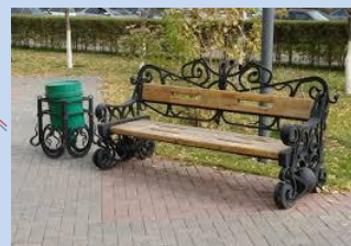
Оновлення лав для відпочинку, встановлення урн для сміття