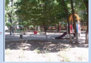
Недостатня кількість елементів дитячого майданчика