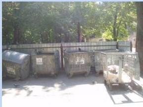
Непривабливий вигляд контейнерного майданчика