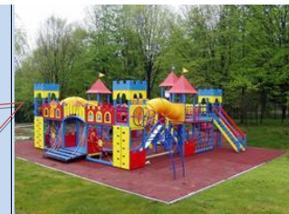
Створення сучасних дитячих ігрових зон