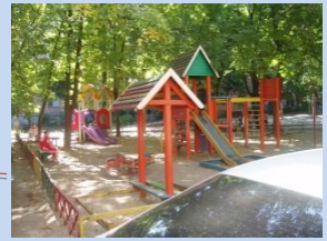
Дитячий майданчик у задовільному стані