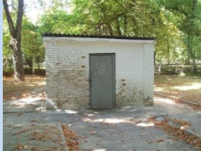
Непривабливий вигляд сміттезбірника