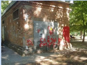
Непривабливий вигляд трансформаторної підстанції