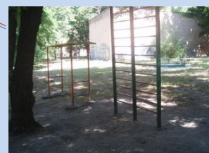
Недостатня кількість елементів спортивного майданчика