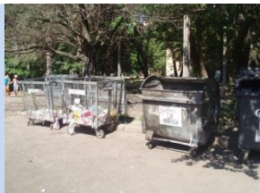
Непривабливий вигляд контейнерних майданчиків