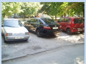
Відсутність зон для паркування автомобілів