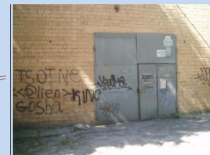
Непривабливий вигляд будівлі бойлерної