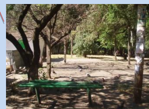
Застарілі конструкції лав для відпочинку, відсутність урн для сміття