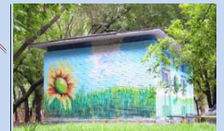
Оформлення фасаду будівлі бойлерної