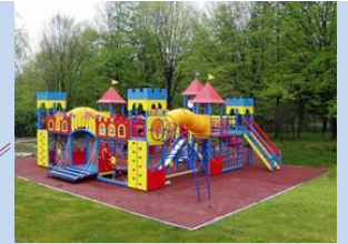
Впорядкування та доукомплектування зони для дитячого дозвілля