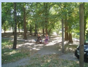
Застаріле покриття або його відсутність на пішохідних доріжках, зелена зона потребує впорядкування