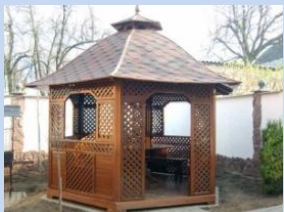
Облаштування альтанок для відпочинку