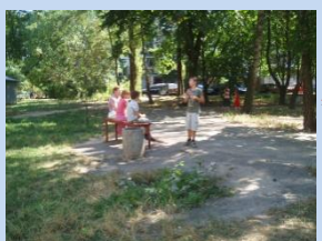
Потребує облаштування зона для відпочинку