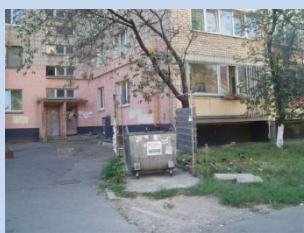
Непривабливий вигляд контейнерного майданчика