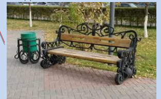
Оновлення лав для відпочинку, встановлення урн для сміття