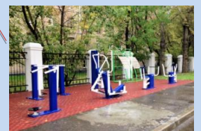
Встановлення додаткових спортивних тренажерів на місці господарського майданчика