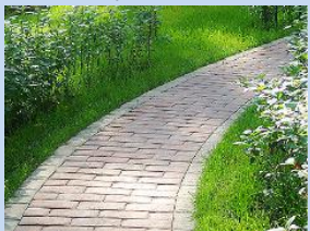
Влаштування мощення пішохідних доріжок впорядкування зеленої зони з висівом газонної трави