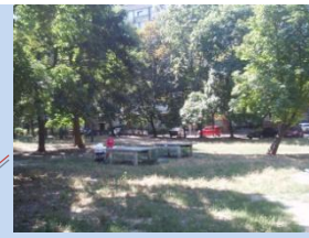
Застарілі конструкції столів для гри в теніс