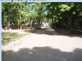
Потребує ремонту асфальтове покриття