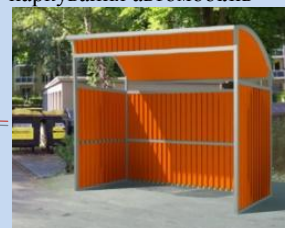
Облаштування контейнерного майданчика