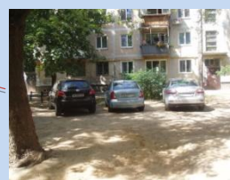
Відсутність зони для паркування автомобілів