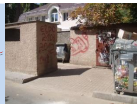
Непривабливий вигляд майданчика для контейнерів