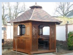
Облаштування альтанок для тихого відпочинку