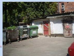
Непривабливий вигляд майданчика для контейнерів