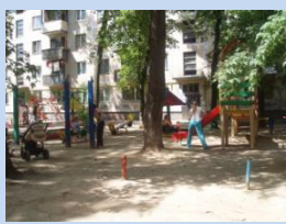
Дитячий майданчик потребує огороження та доукомплектування елементами