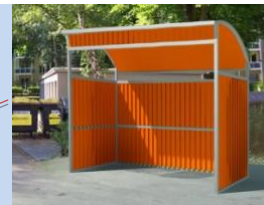
Облаштування контейнерного майданчика