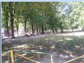
Зелена зона потребує впорядкування