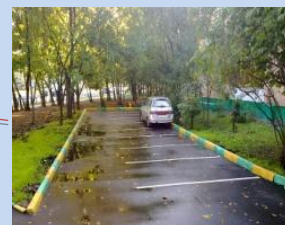
Облаштування зони для паркування автомобілів