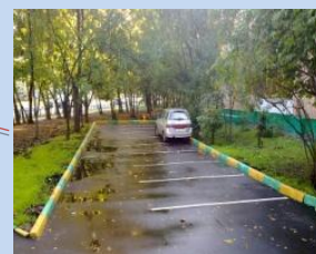
Облаштування зони для паркування автомобілів