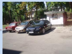
Необхідність облаштування майданчика для паркування автомобілів