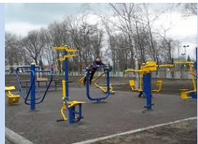
Формування зони спортивного відпочинку на місці старого господарського майданчика