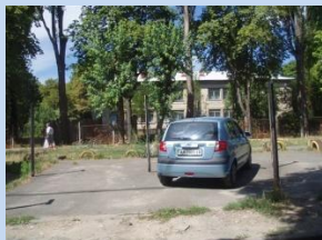
Застарілий господарський майданчик