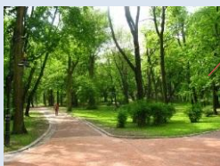
Впорядкування зеленої зони