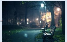
Встановлення лав для відпочинку та облаштування зовнішнього освітлення