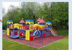
Формування сучасних зон дитячого відпочинку