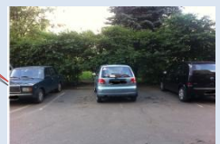
Облаштування майданчиків для паркування автомобілів