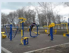
Формування зон спортивного відпочинку в місцях старих господарських майданчиків