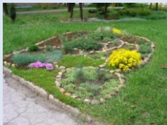
Впорядкування зеленої зони