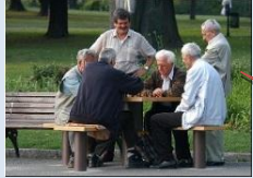
Створення зон для тихого відпочинку