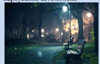
Встановлення лав для відпочинку та облаштування зовнішнього освітлення