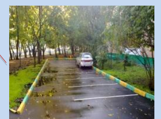
Облаштування зони для паркування автомобілів