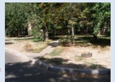
Відсутнє мощення доріжок, відсутність огороження зеленої зони