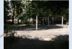
Непривабливий вигляд господарського майданчика