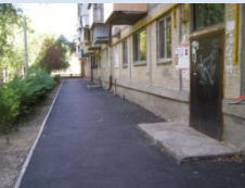
Асфальтове покриття у задовільному стані, відсутність паркану