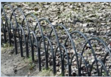
Влаштування декоративної огорожі між асфальтовим покриттям і зеленою зоною