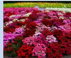
Облаштування квіткових клумб