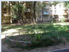
Недостатнє впорядкування зеленої зони