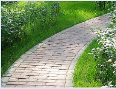
Влаштування мощення доріжок, впорядкування зеленої зони