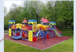
Формування зони дитячого відпочинку на місці застарілого господарського майданчика