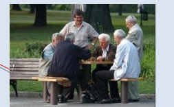
Створення зони для тихого відпочинку