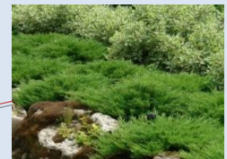
Створення зон з вічнозеленими рослинами