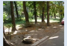
Недостатнє впорядкування зеленої зони