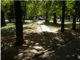
Відсутнє мощення доріжок, відсутність огороження зеленої зони