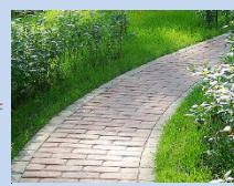
Влаштування моцнення доріжок