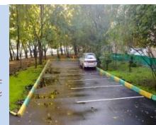
Облаштування зон для паркування автомобілів