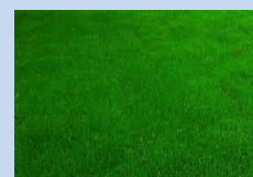
Облаштування зеленої зони з висівом газонаї трави