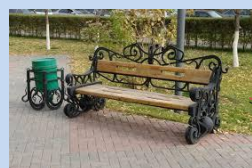
Встановлення лав для відпочинку та урн для сміття