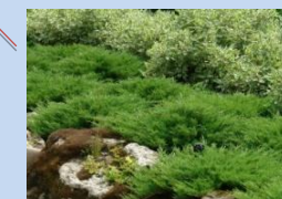
Створення зон з вічнозеленими рослинами