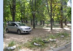
Відсутність зони для паркування автомобілів