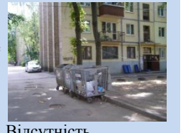
Відсутність обладнаного контейнерного майданчика