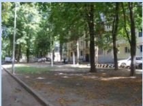
Відсутнє зонування території