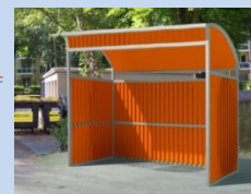
Облаштування контейнерного майданчика