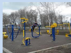
Встановлення вуличних тренажерів на місці господарського майданчика