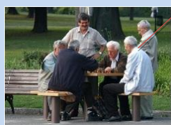
Створення зони для тихого відпочинку