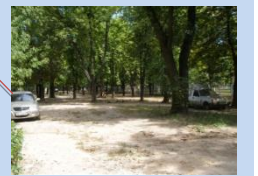
Нераціональне використання території