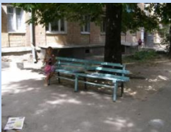
Застарілі конструкції лав для відпочинку, відсутні урни для сміття