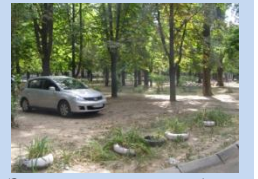
Зелена зона потребує впорядкування