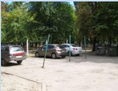
Непривабливий вигляд елементів господарського майданчика