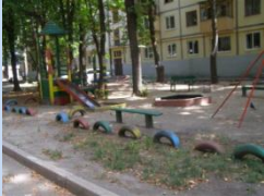
Застарілі конструкції дитячих майданчиків

Територія, обмежена будинками № 89/25 на бульв. І.Лепсе, № 23, 23-а на вул. М.Донця Сучасний стан