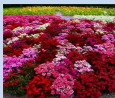
Облаштування квіткових клумб