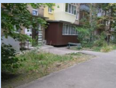
Невпорядкована зелена зона