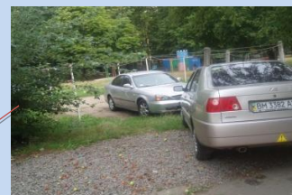
Відсутність зони для паркування автомобілів