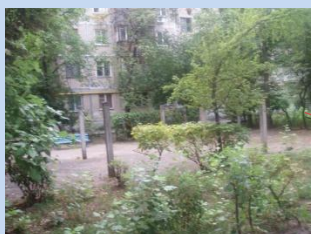
Застарілий господарський майданчик