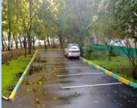
Облаштування зони для паркування автомобілів