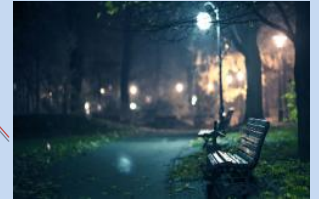
Встановлення лав для відпочинку та облаштування зовнішнього освітлення