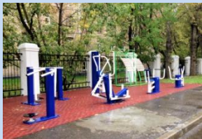
Облаштування зони для спортивного відпочинку на місці старого господарського майданчика