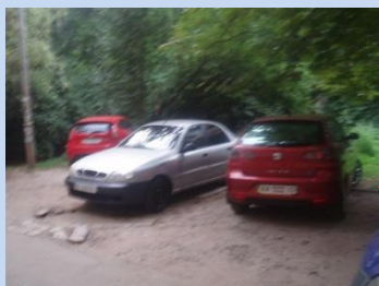
Відсутність зони для паркування автомобілів