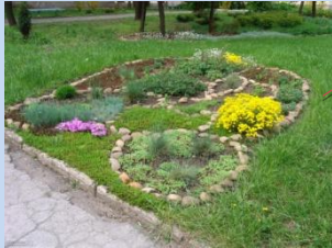
Впорядкування зеленої зони