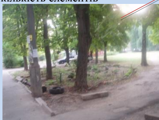
Невпорядкована зелена зона