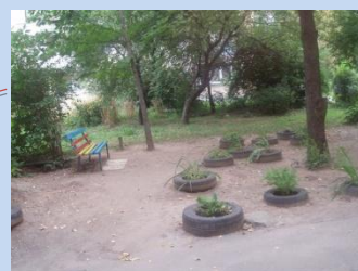
Існуючий стан зелених насаджень