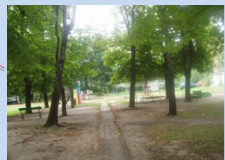
Застаріле покриття пішохідних доріжок