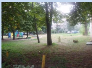
Застаріле обладнання дитячого майданчика. Недостатня кількість елементів