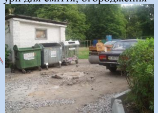
Існуючий вигляд контейнерного майданчика та сміттєзбірника