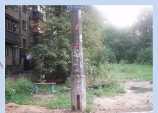
Відсутність у достатній кількості лав для відпочинку, урн для сміття, огороження