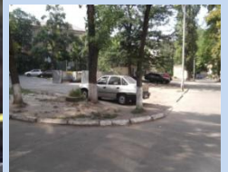
Існуючий стан зелених насаджень