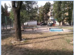
Недостатня кількість елементів дитячого майданчика