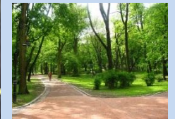
Впорядкування зеленої зони