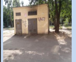
Фасад ТП-1669 на прибудинковій території