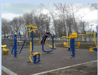
Формування зони спортивного відпочинку