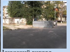
Існуючий вигляд контейнерного майданчика