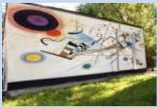
Оформлення фасаду сміттєзбірника