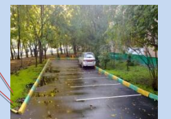
Облаштування зон для паркування автомобілів