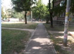
Відсутнє мощення доріжок