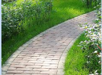
Влаштування мощення доріжок