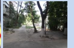
Відсутність у достатній кількості лав для відпочинку, урн для сміття, огороження