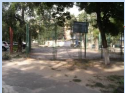
Існуюче обладнання спортивного майданчика. Недостатня кількість елементів