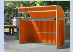
Облаштування контейнерного майданчика