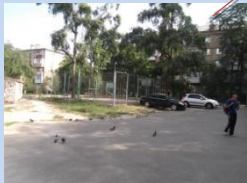
Відсутнє функціональне зонування прибудинкових територій