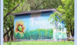
Оновлення фасаду ТП 1669