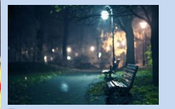
Встановлення лав для відпочинку та облаштування зовнішнього освітлення