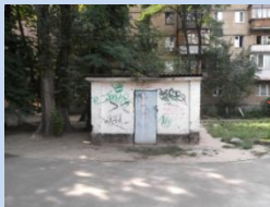
Непривабливий вигляд смітєзбірника