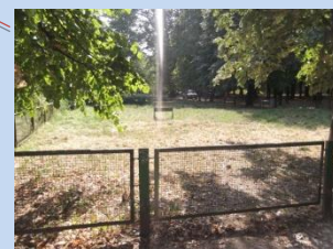
Існуючий стан зони для вихулу тварин