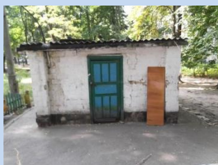
Непривабливий вигляд смітєзбірників