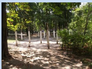
Обладнання господарського майданчика