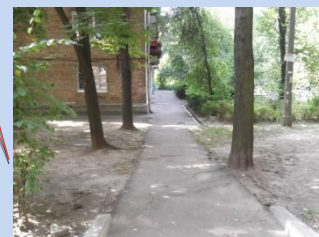
Відсутність мощення пішохідних доріжок