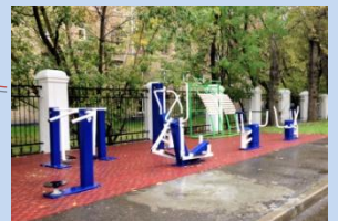
Встановлення додаткових спортивних тренажерів