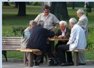
Створення зон для тихого відпочинку на місці господарських майданчиків