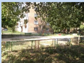
Існуючі елементи зон для дитячого відпочинку