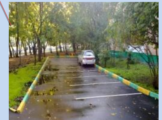
Облаштування зони для паркування автомобілів