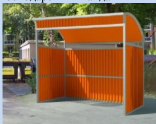
Облаштування контейнерного майданчика на місці старих сміттєзбірників