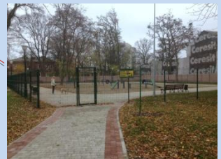
Облаштування зони для вигулу тварин