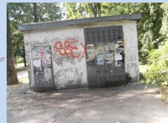
Непривабливий вигляд будівлі ТП-2110