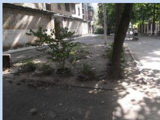
Непривабливий вигляд зеленої зони