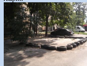
Відсутність організованого паркування автомобілів