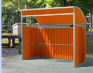
Облаштування контейнерного майданчика на місці старого сміттєзбірника