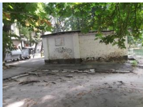
Непривабливий вигляд смітєзбірника