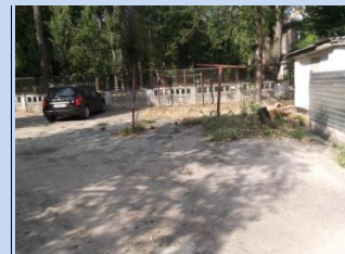
Застарілі елементи господарського майданчика, потребує впорядкування зелена зона