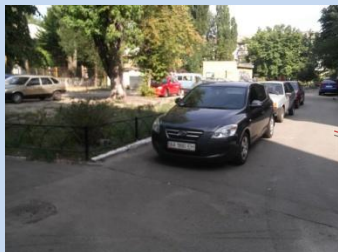
Відсутність зони для паркування автомобілів