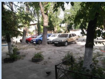
Непривабливий вигляд зеленої зони, відсутність зони для паркування