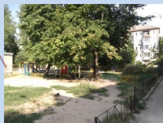
Потребує дообладнання дитячий майданчик, потребує впорядкування зелена зона