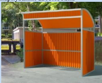
Обладнання контейнерного майданчика