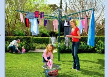
Встановлення сучасних елементів для сушіння білизни