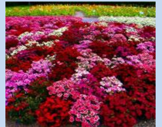
Облаштування квіткових клумб