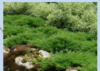
Облаштування зеленої зони