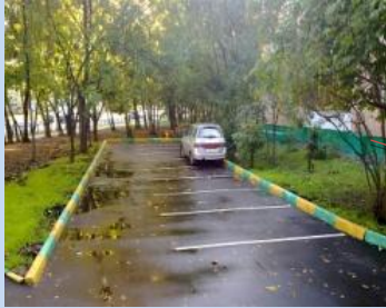
Облаштування зони для паркування автомобілів