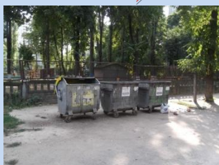
Потребує обладнання контейнерний майданчик