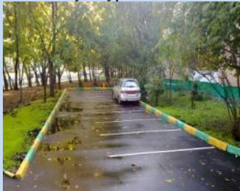
Облаштування зони для паркування автомобілів