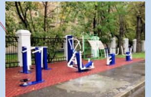
Встановлення вуличних тренажерів