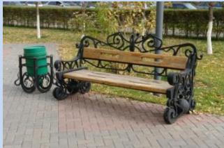
Встановлення лав для відпочинку та урн для вміття