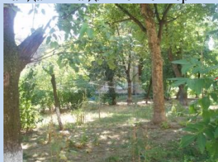
Нераціональне використання території