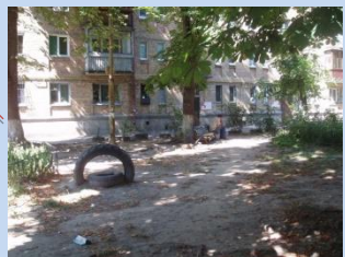
Застарілі конструкції лав для відпочинку, відсутність урн для сміття, зелена зона потребує впорядкування