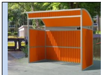
Облаштування контейнерного майданчика на місці старого сміттєзбірника