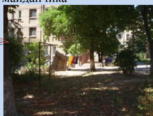
Непривабливий вигляд елементів господарських майданчиків