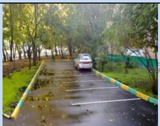
Облаштування зон для паркування автомобілів