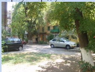
Відсутність зон для паркування автомобілів