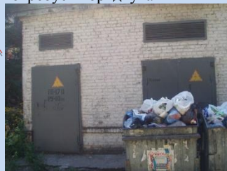
Непривабливий вигляд ТП, майданчик для контейнерів потребує впорядкування