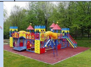
Облаштування дитячої ігрової зони