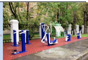
Встановлення сучасних елементів для занять спортом