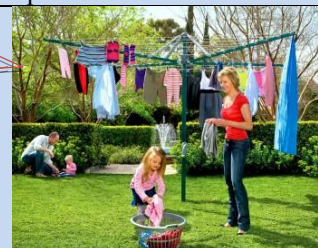
Встановлення сучасних конструкцій для сушіння білизни