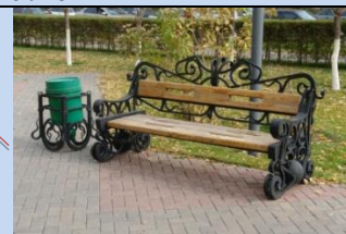
Оновлення лав для відпочинку, урн для сміття, впорядкування зеленої зони, влаштування покриття