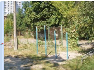
Застарілі елементи спортивного майданчика