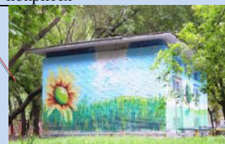
Оформлення фасаду трансформаторної підстанції