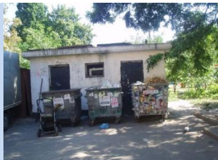
Непривабливий вигляд сміттєзбірника та відсутність майданчика для контейнерів