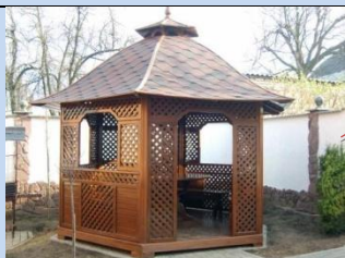
Встановлення альтанки для тихого відпочинку