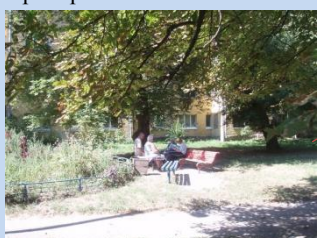
Застарілі конструкції лав для відпочинку, відсутність урн для сміття, зелена зона потребує впорядкування