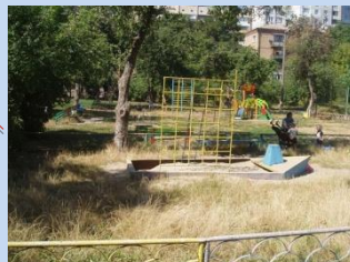
Застарілі елементи дитячого майданчика