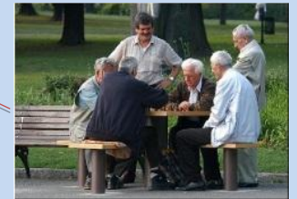
Створення зони для настільних ігор на місці господарського майданчика