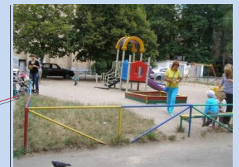
Недостатня кількість елементів дитячого майданчика