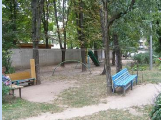
Застарілі конструкції дитячого майданчика, лав для відпочинку, відсутні урни для сміття