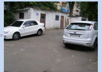
Потребує облаштування зона для паркування автомобілів