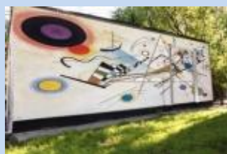
Оформлення фасаду сміттєзбірника