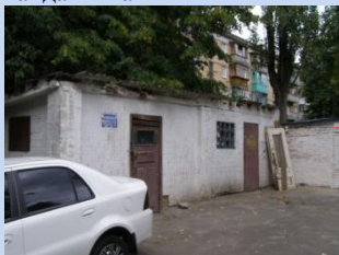
Непривабливий вигляд сміттєзбірника