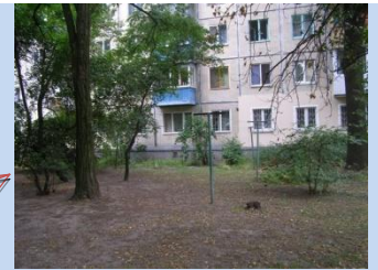
Застарілі конструкції господарських майданчиків