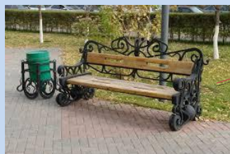
Встановлення лав для відпочинку, урн для сміття, влаштування нового покриття