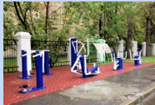
Встановлення вуличних тренажерів на місці старого господарського майданчика