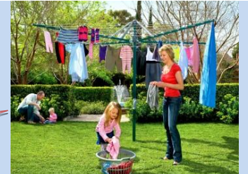
Встановлення сучасних конструкцій для сушіння білизни