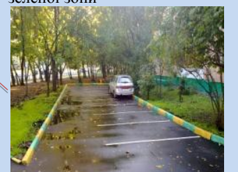
Облаштування зони для паркування автомобілів