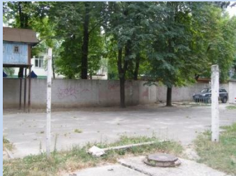
Непривабливий вигляд конструкцій господарського майданчика