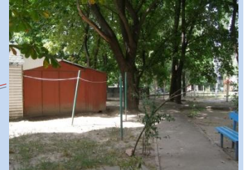
Застаріле покриття доріжок, потребує облаштування зелена зона