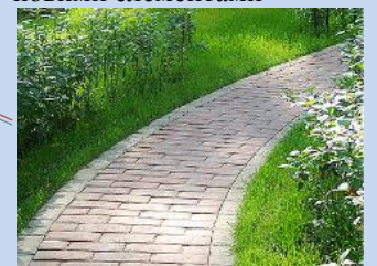
Влаштування мощення доріжок, впорядкування зеленої зони