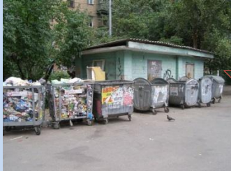
Непривабливий вигляд сміттєзбірників і контейнерних майданчика