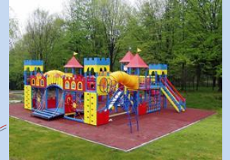
Облаштування зони для дитячого дозвілля, впорядкування зеленої зони