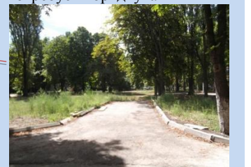
Зруйнований бортовий камінь, застаріле покриття доріжок