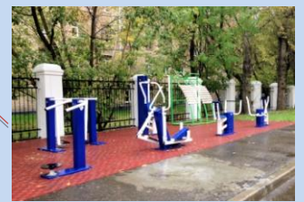
Встановлення вуличних тренажерів на місці господарського майданчика