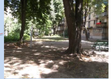
Потребує впорядкування зелена зона, недостатня кількість лав, відсутні урни для сміття