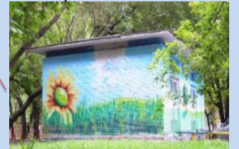
Оформлення фасаду трансформаторної підстанції