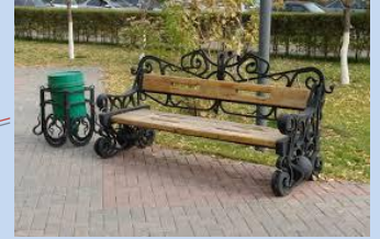
Встановлення лав для відпочинку, урн для сміття, влаштування нового покриття