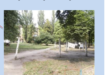
Непривабливий вигляд господарського майданчика