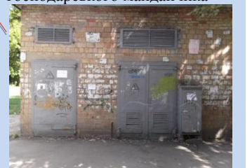
Непривабливий вигляд будівлі трансформаторної підстанції