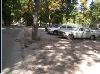
Відсутність зони для паркування автомобілів