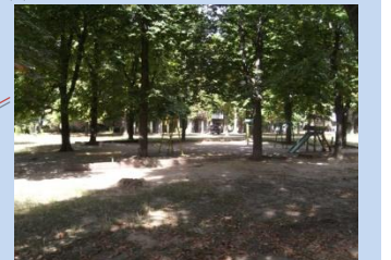
Застарілі конструкції дитячого майданчика, зелена зона потребує впорядкування