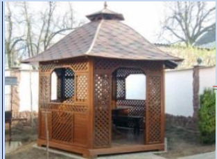
Використання значної вільної площі для облаштування альтанок, зон для настільних ігор