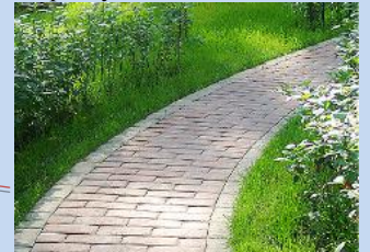
Влаштування мощення доріжок, впорядкування зеленої зони