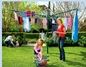
Встановлення сучасних конструкцій для сушіння білизни