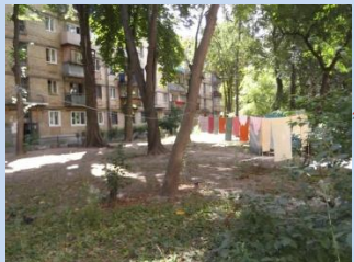
Потребує облаштування господарський майданчик