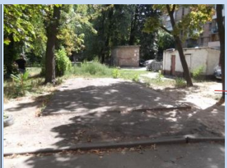
Нераціональне використання території