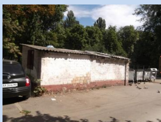
Потребує впорядкування зони для паркування автомобілів