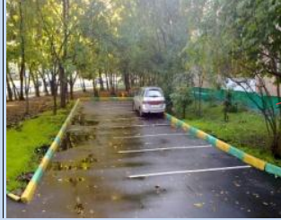
Облаштування зони для паркування автомобілів