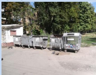
Непривабливий вигляд контейнерного майданчика