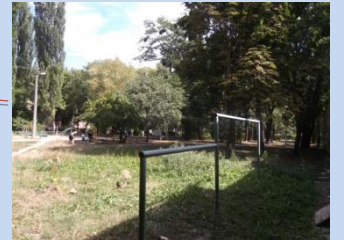
Застарілі конструкції спортивного майданчика