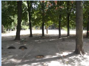
Відсутні лави для відпочинку, урни для сміття, пошкоджене асфальтове покриття