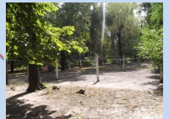
Непривабливий вигляд конструкцій господарського майданчика