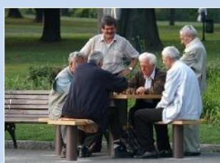
Облаштування зони для гри в настільні ігри