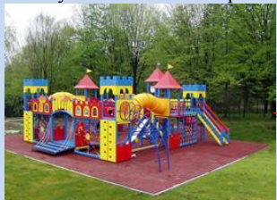
Створення зони для дитячого дозвілля