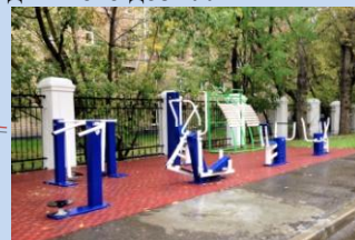
Встановлення сучасних вуличних тренажерів