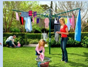
Встановлення сучасних конструкцій для сушіння білизни