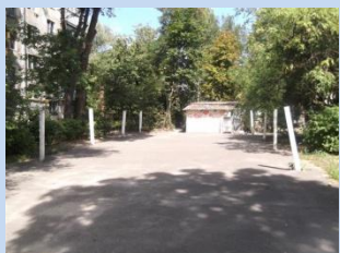
Обладнання господарського майданчика