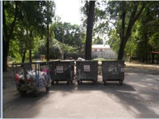
Непривабливий вигляд контейнерного майданчика