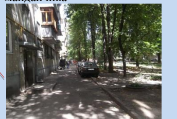
Потребує впорядкування зелена зона