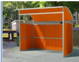
Облаштування контейнерного майданчика