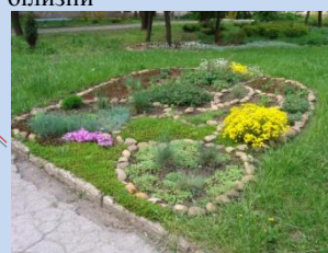
Впорядкування зелених зон, облаштування квіткових клумб