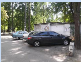
Відсутність зони для паркування автомобілів