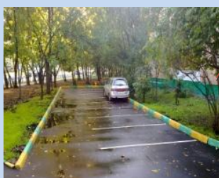
Облаштування зони для паркування автомобілів