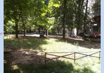
Відсутня зона дитячого дозвілля