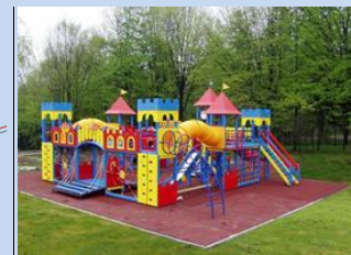
Облаштування зони для дитячого дозвілля