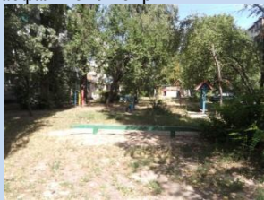
Недостатня кількість елементів для дитячого дозвілля